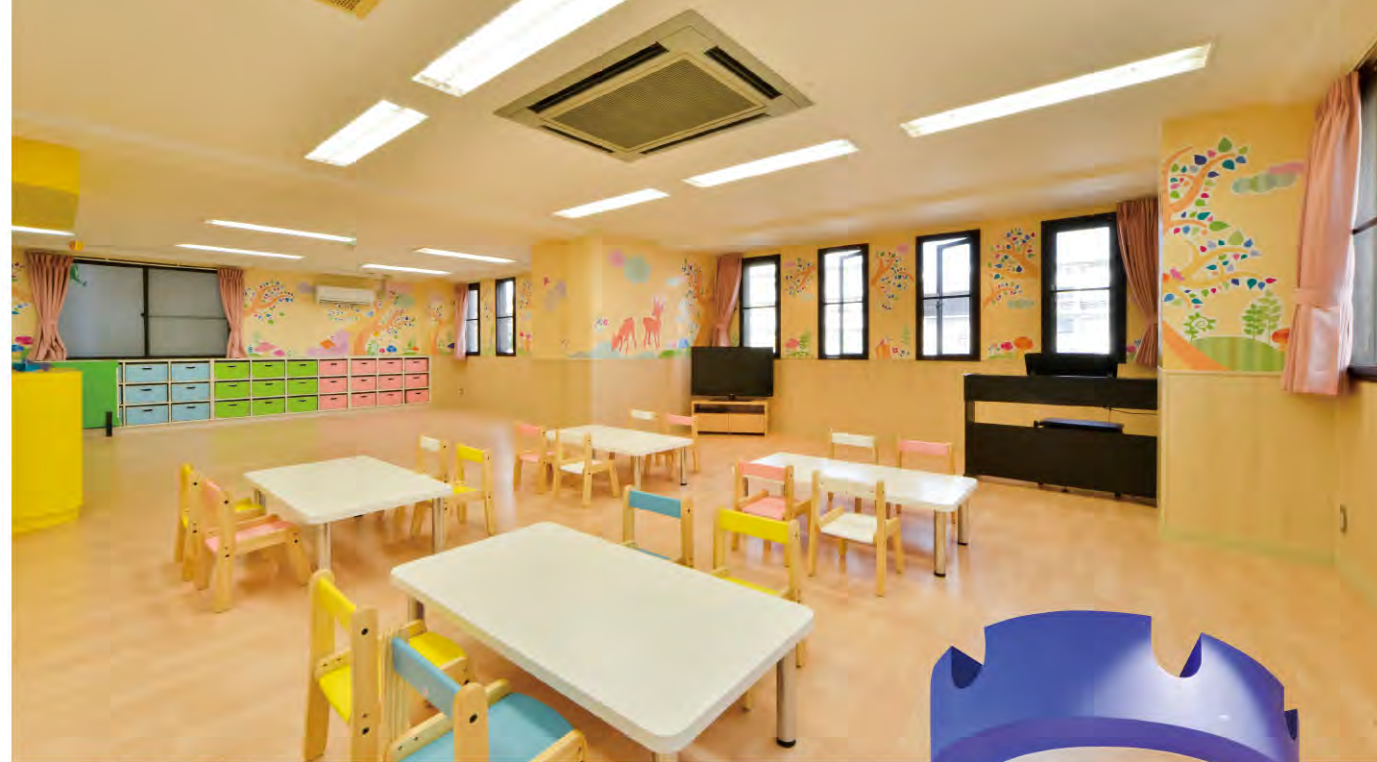
●2階保育室 広いお部屋に森をイメージした壁面グラフィックが子供たちをワクワクさせます。